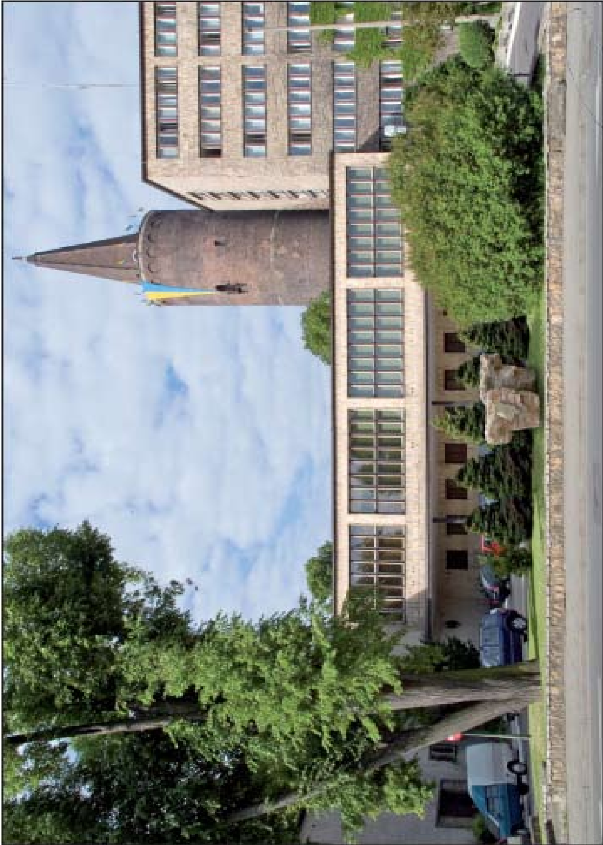
Załącznik nr 2 - wizualizacja usytuowania pomnika.